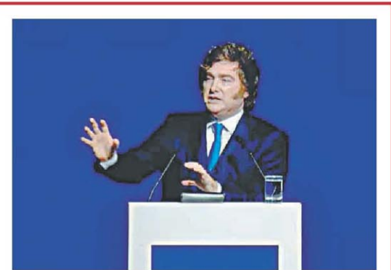
El Presidente cerró el encuentro de AmCham

La inflación volvió a acelerar en marzo y encendió nuevas señales de alarma para el oficialismo. De acuerdo con lo informado por el Instituto Nacional de Estadística y Censos (INDEC), el Índice de Precios al Consumidor (IPC) registró una suba mensual de 3,4%, el nivel más alto desde marzo de 2025 y la primera vez en un año que el indicador supera el umbral del 3%. Con este resultado, la inflación acumulada a lo largo del primer trimestre alcanzó el 9,4%, quedando a muy poca distancia de la meta anual de 10,1% proyectada por el Gobierno nacional en el Presupuesto aprobado por el Congreso. PÁG. 2